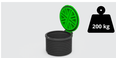
TELESZKÓPOS HOSSZABBÍTÓ ÉS DN600 as MÉRETŰ ZSANÉROS FEDŐ [cikkszám: 7600088710]